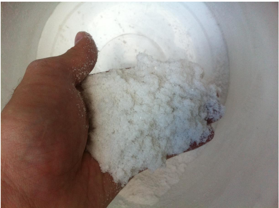
Рис.3 Порошок полиэтилена

Производительность опытной мельницы составила 11кг/час.