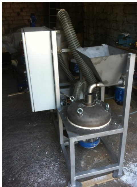
Рис. 1 Опытная мельница РВМ-4-300