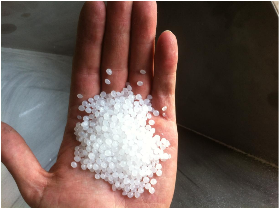
Рис.2 Гранулы полиэтилена